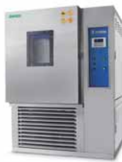
可程式恆溫恆濕箱