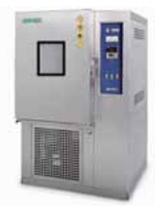
實用型恆溫恆濕型

CHINEE INSTRUMENT CO., LTD. CHINEE PRECISION INDUSTRY CO., LTD.